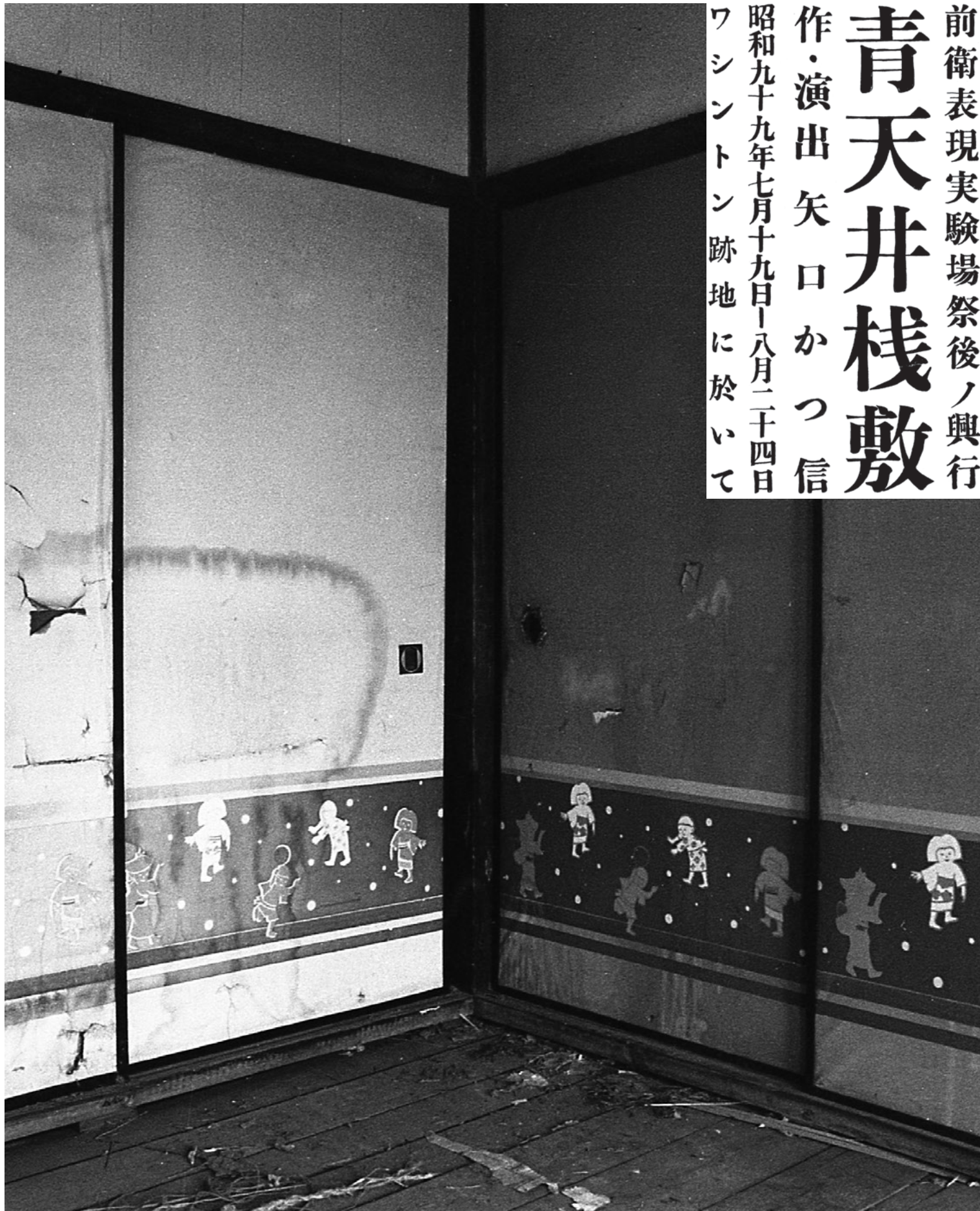
『襖(わらしあそび)』2013 ©Katsunobu Yaguchi

AVANTGARDE EXPRESSION LABORATORY LAST SHOW "AOTENJO-SAJIKI" BY KATSUNOBU YAGUCHI 19TH JULY - 24TH AUGUST 2024 AT THE WASHINGTON SITE