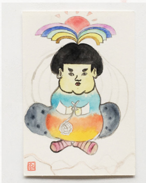
『大金玉様』2010-2024年、紙に水彩画