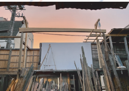
『野生の施工』2013-2024年、記録映像、1時間30分